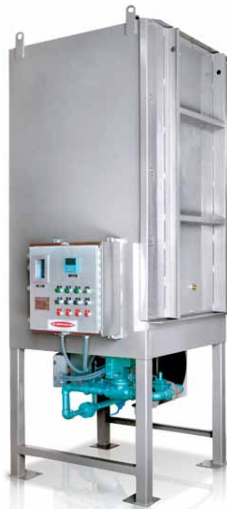
La carcasa del CTHX está disponible en acero pintado o en acero inoxidable opcional, como se muestra.

Toda la tubería de combustión está montada debajo de la carcasa. Los dispositivos de seguridad del quemador incluyen protección electrónica de la llama y encendido provocado por chispa, además de sistemas de cierre por sobretemperatura del aceite. Los controles para el quemador, ventilador impelente y protectores de la combustión se encuentran adosados al costado de la carcasa.