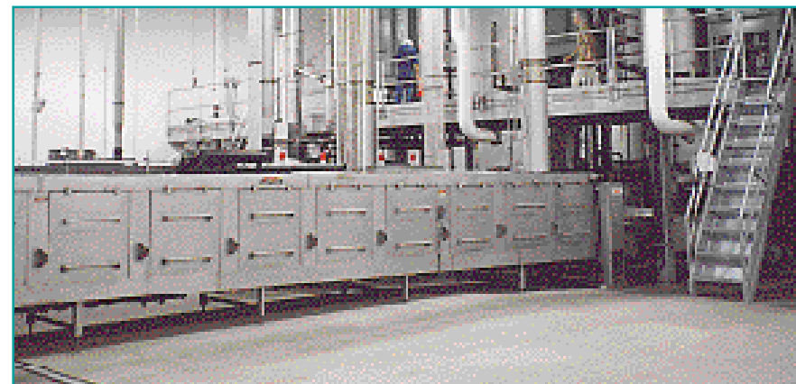
Se ofrecen hornos de tostar de una sola pasada para tortillas, tortillas para tacos y otros productos de panadería.