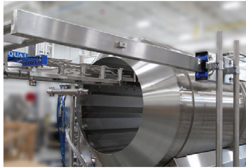
Ensamblaje opcional de extracción tipo carro del distribuidor