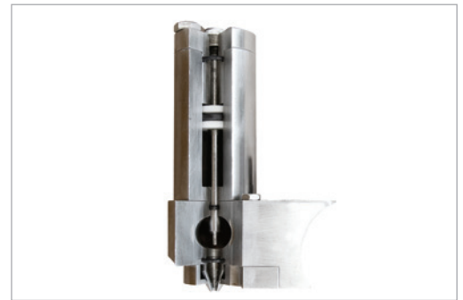
Boquilla de pulverización de lodo con mecanismo de pistón de limpieza