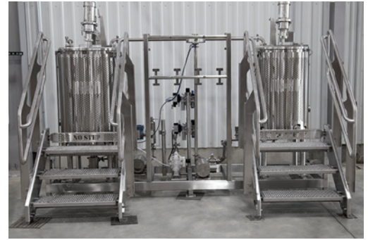
Bastidor de tanque para mezclar/usar