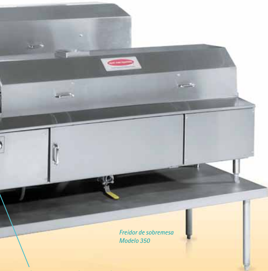
Freidor de sobremesa Modelo 350

La temperatura y el transportador son controlados desde un cómodo panel montado en el freidor.