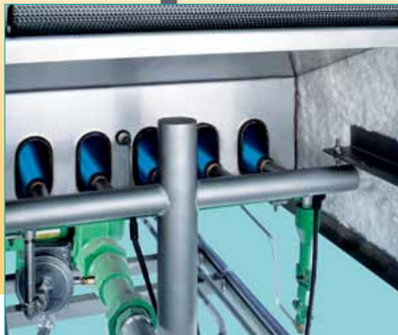
Los freidores modelo 700 se calientan con llama de gas directa. Los freidores modelos 350 y 450 se calientan eléctricamente.