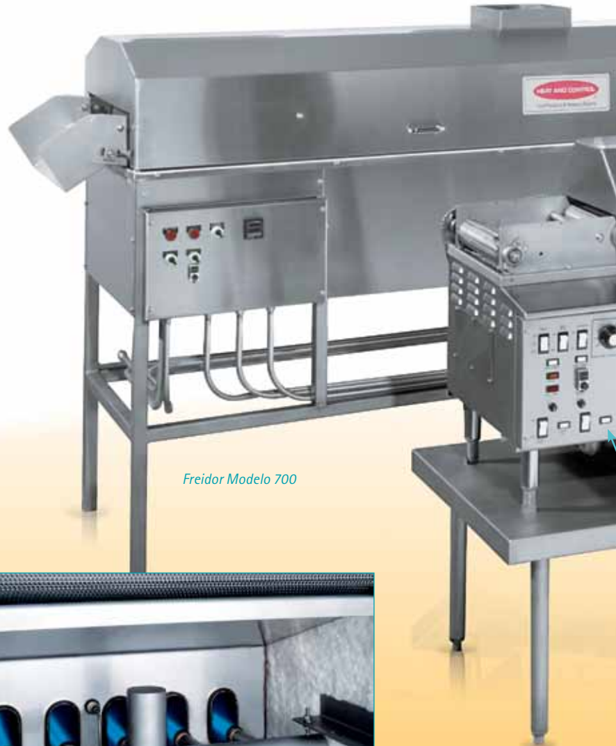
Freidor Modelo 700

Las campanas fáciles de retirar, los transportadores desmontables y los elementos calentadores suspendidos simplifican la limpieza. Los freidores se fabrican para cumplir con las normas del USDA (Departamento de Agricultura de los Estados Unidos).