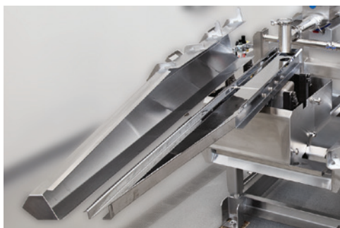
可实现最佳覆盖效果的斜切盘具设计。